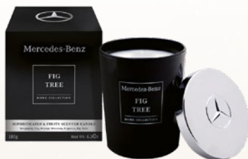
Fig Tree B66959757 77,00 €